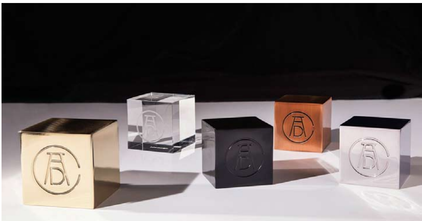
«Art Directors Club» Preis