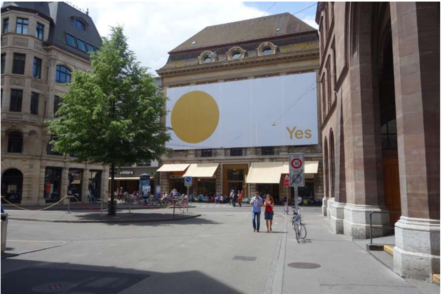
Basel, Fassadenplakat beim «unternehmen mitte»