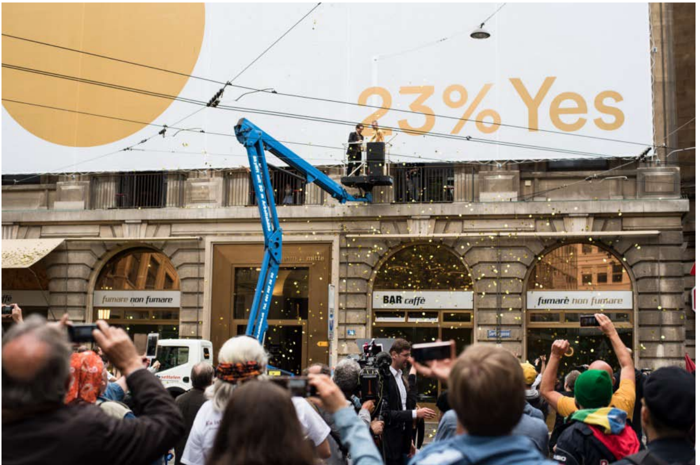
Basel, Volksabstimmung am 5. Juni 2016