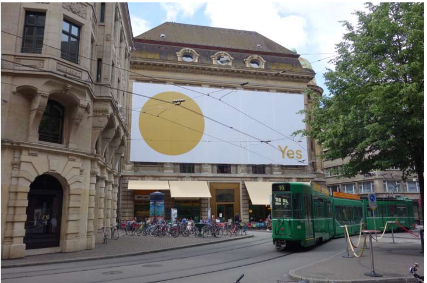
Basel, Fassadenplakat beim «unternehmen mitte»